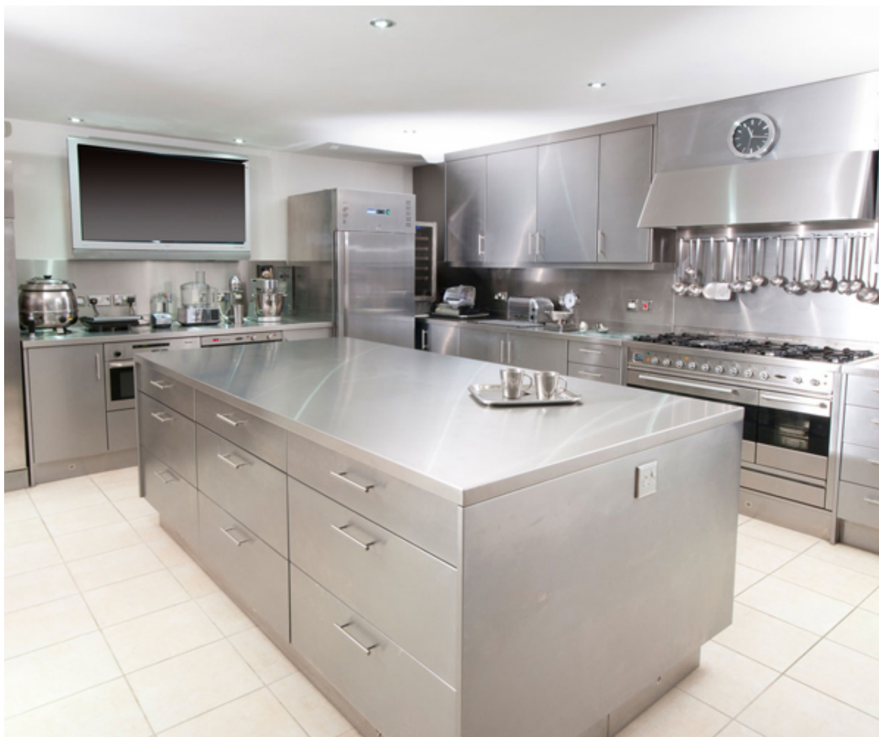
gia inox - Không gian bếp inox