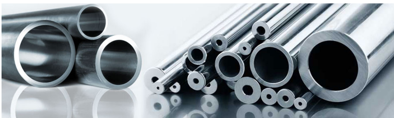
gia inox ống công nghiệp

Về mặt giá cả thị trường: gia inox 201 rẻ hơn so với gia inox 304 , vì được làm từ nguyên liệu thô nhiều hơn, trong đó dùng Mangan để thay thế Niken. Nhờ giá cả thấp và ổn định mà inox 201 là một lựa chọn phù hợp cho nhiều mặt hàng phổ biến ở nhiều thị trường khác nhau.